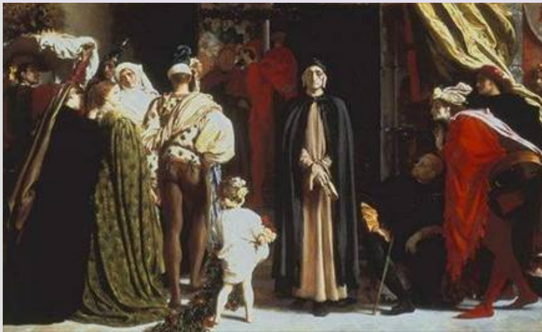
Dante en el exilio

Tanto los güelfos como los gibelinos representaban las dos fuerzas políticas más importantes de Florencia durante el siglo XIII. Los gibelinos adherían al poder del Emperador sobre Florencia, en tanto que los güelfos defendían la supremacía del Papa. Con el devenir del tiempo el partido güelfo se transformó, en cierto sentido, en un partido de carácter nacionalista, al sostener a los principados y repúblicas de Italia que estaban demandando derechos y libertades municipales y provinciales. Dentro de este partido, a su vez, había profundas divisiones: por un lado, los negros , de tendencia radical y por otro los blancos , más moderados. A la facción de los blancos pertenecía Dante.