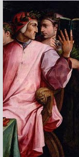
Seis poetas toscanos (detalle) Giorgio Vasari, 1544

El modelo de Lattini y la amistad de Dante con el poeta Guido Cavalcanti despertaron su interés por la literatura latina y, muy especialmente, por la obra del poeta Virgilio :