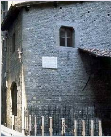
Casa natal de Dante, Florencia.