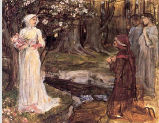
Dante y Beatriz en el Purgatorio

En 1315 el gobierno de Florencia ofreció una amnistía a Dante pero éste no la aceptó por considerar que eran indignas las condiciones que se le imponían para alcanzarla. Esto llevó a que pesara otra condena más sobre él: si regresaba a Florencia sería decapitado.