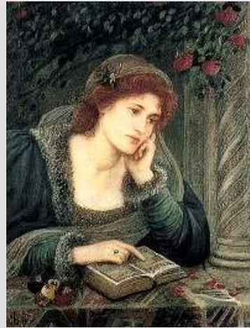
Beatriz Mari Spartali, 1895

“...decir de ella lo que nunca de nadie se ha dicho. Y luego quiera aquel que es señor de toda cortesía que mi alma pueda irse a ver la gloria de su señora, esto es, de la bienaventurada Beatriz, la cual gloriosamente contempla el rostro de aquel qui est per omnia secula benedictus (el que es por siempre bendito)”. (Vita Nuova, XLII)