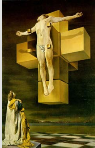
Corpus Hypercubus S.Dalí, 1954

El Vexilla Regis es un himno latino del Obispo Venancio Honorio Clemenciano Fortunato (siglo VI).