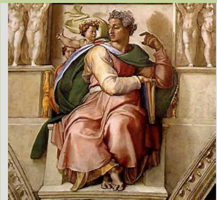
El profeta Isaías Capilla Sixtina, M.Ángel

En términos generales, se puede ubicar el proceso de formación del Antiguo Testamento en el lapso que va desde el siglo XX al I antes de Cristo.