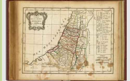
Ilustración de Jean Lattre, 1800

En el Antiguo Testamento hay varias formas literarias que se pueden agrupar en dos grandes categorías: prosa histórica y poesía .