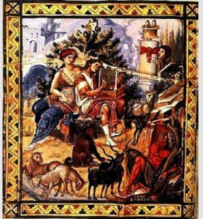
David componiendo salmos, siglo X

Todos los textos que integran este género fueron compuestos casi completamente en verso. En la Biblia la poesía no se basa en la cantidad de sílabas, sino en recursos como el paralelismo y otras formas de repetición.