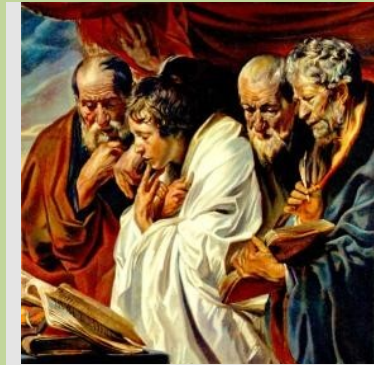
Los cuatro Evangelistas J.Jordaens, 1620