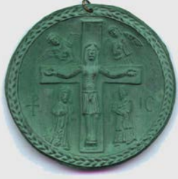
Arte cristiano primitivo

Las distintas ramas cristianas aceptan por igual los veintisiete libros del Nuevo Testamento . Sin embargo, cuando a partir del siglo XVI se produjo la separación entre católicos y protestantes, cada iglesia reconoció diferentes cánones para el Antiguo Testamento: los protestantes aceptan los treinta y nueve libros del canon hebreo y los católicos los cuarenta y seis del canon alejandrino .