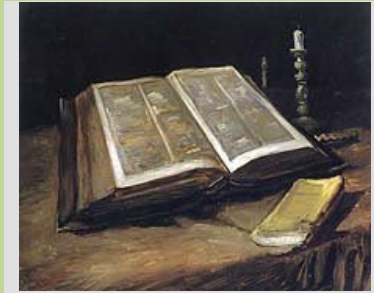
Naturaleza muerta con Biblia Vincent Van Gogh, 1885