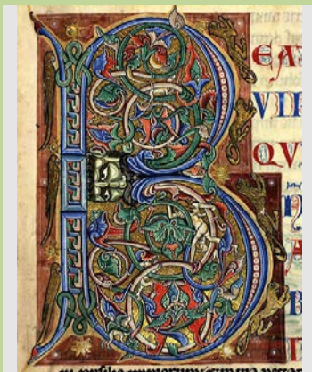
Inicial ornamentada, siglo XI

Para el Antiguo Testamento hay dos cánones: