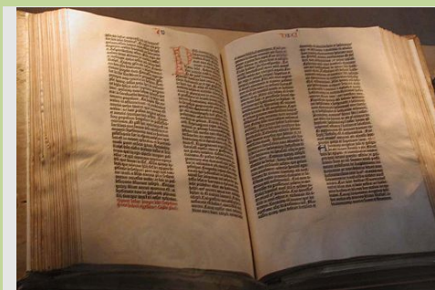
Biblia de Gutenberg, 1546

Los griegos se referían a ella con el término teopneustia .