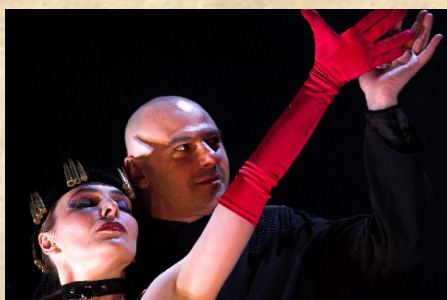
(“Macbeth”, Synetic Theatre,2007)

Lee los comentarios que aparecen más abajo y reflexiona sobre la forma en que opera la ambición en el personaje de Lady Macbeth.