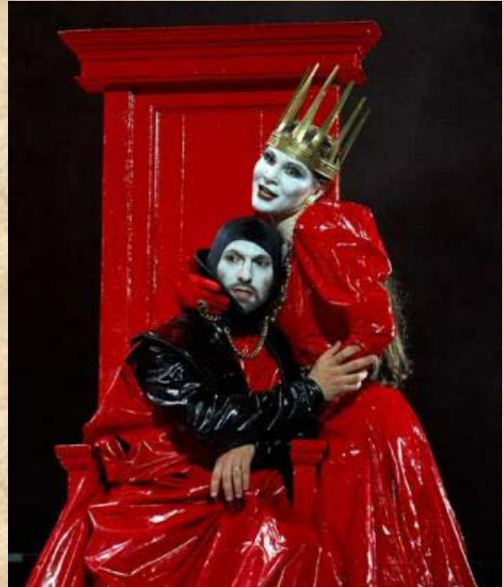
( Macbeth - Pier Luigi Pizzi, 2007)

Observa los detalles simbólicos y la composición de la imagen que aparece a la derecha y explica en base a ella el sentido y los elementos significativos de la tragedia Macbeth .